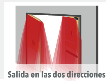
Salida en las dos direcciones

SEGURIDAD MEJORADA El campo de detección se extiende más allá del área de la bisagra