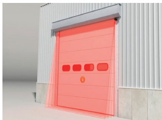
Portes industrielles automatiques