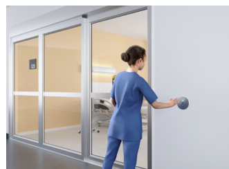
Centros de salud