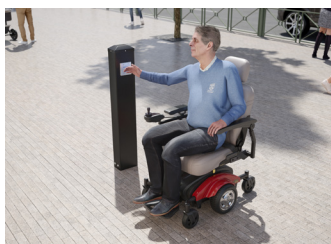
Ambientes ao ar livre

AVISO DE ISENÇÃO As informações são fornecidas mediante a condição de que as pessoas que a receberem decidirão por si mesmas sobre a adequação a suas finalidades antes de usar. Sob nenhuma circunstância a BEA será responsável por danos de qualquer natureza, seja quais forem, resultantes do uso ou da dependência das informações deste documento ou dos produtos aos quais as informações se referem. A BEA tem o direito, sem responsabilidade, de alterar as descrições e as especificações a qualquer momento.